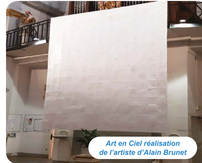
Art en Ciel réalisation de l'artiste d'Alain Brunet