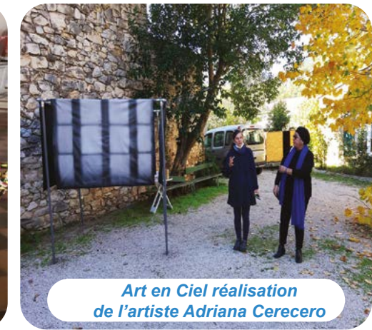
Art en Ciel réalisation de l'artiste Adriana Cerecero