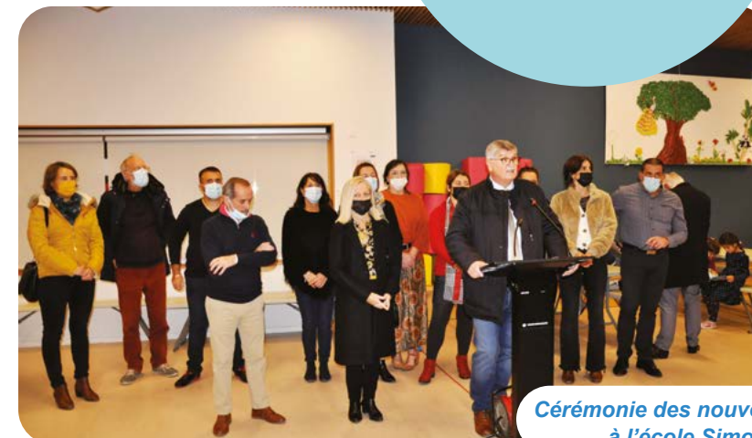
Cérémonie des nouveaux arrivants à l'école Simone Veil