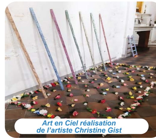
Art en Ciel réalisation de l'artiste Christine Gist