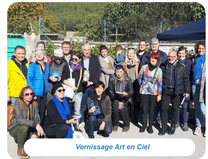
Vernissage Art en Ciel