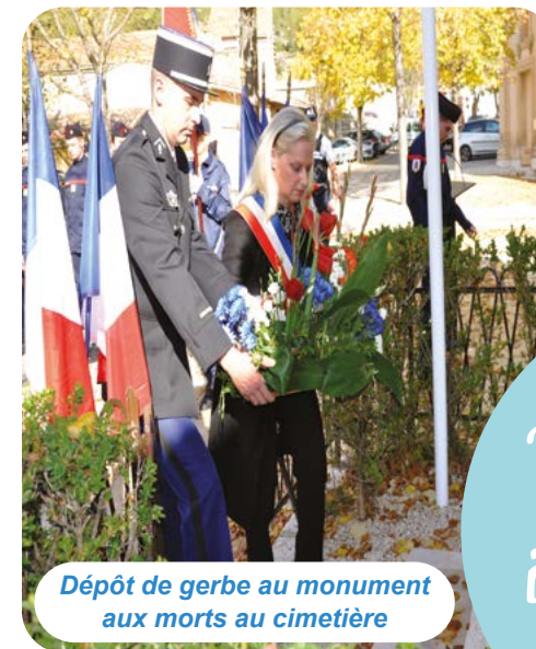
Dépôt de gerbe au monument aux morts au cimetière