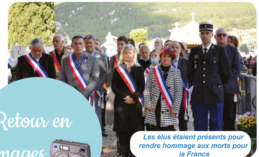
Les élus étaient présents pour rendre hommage aux morts pour la France