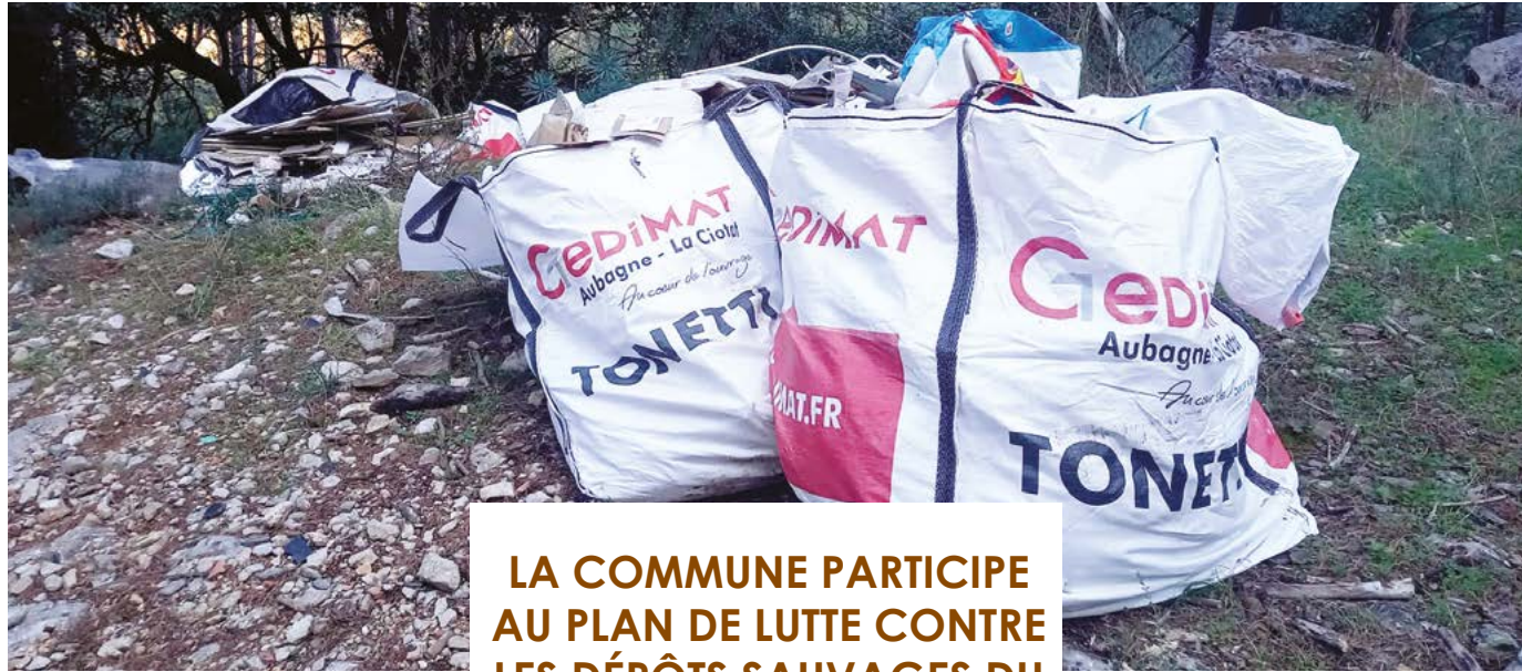
LA COMMUNE PARTICIPE AU PLAN DE LUTTE CONTRE LES DÉPÔTS SAUVAGES DU PNR

Malheureusement, les abandons de déchets sont omniprésents sur le territoire du Parc Naturel Régional de la Sainte Baume. Ces dépôts sauvages polluent les milieux naturels, les sols, les eaux, l'air et dégradent nos paysages.