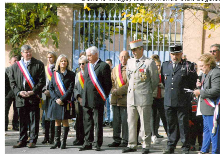
A l'occasion de l'armistice de 1918, les enfants ont chanté la Marseillaise devant le monument aux morts du boulevard Gambetta