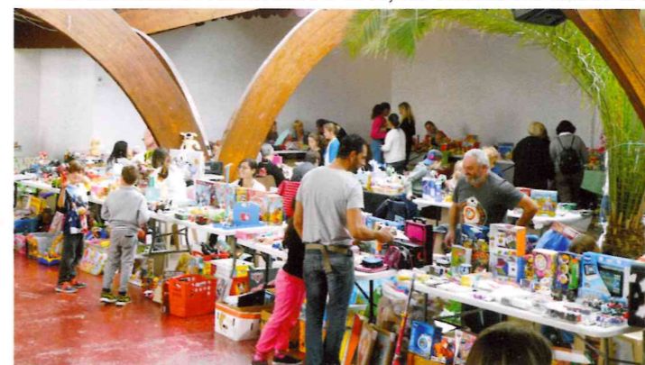
La FCPE a organisé cette année encore une bourse aux jouets, l'occasion de faire des affaires !