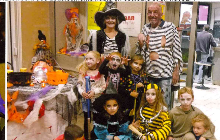
Dans le village, tout le monde était déguisé et les commerçants ont eux aussi joué le jeu.