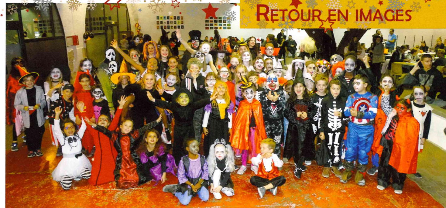
L'association tadlachance a réussi une belle soirée pour Halloween, des déguisements hauts en couleurs et en frayeur !