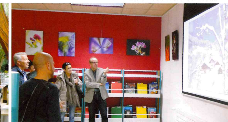
Vernissage de l'exposition «Regards croisés» à la médiathèque