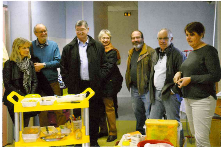
Visite des élus et des personnes associées à la crèche pour le déjeuner des petits.