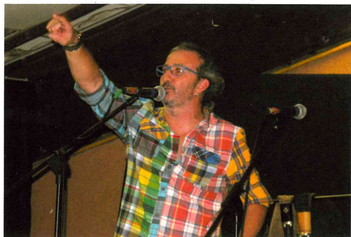
Mazurka, scottish, polka, valse... ont fait danser toutes les personnes venues au baléti.