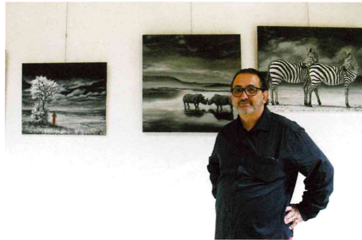
Magnifiques tableaux de Vincent Contréras qui ont été exposés au mois de janvier à la médiathèque.