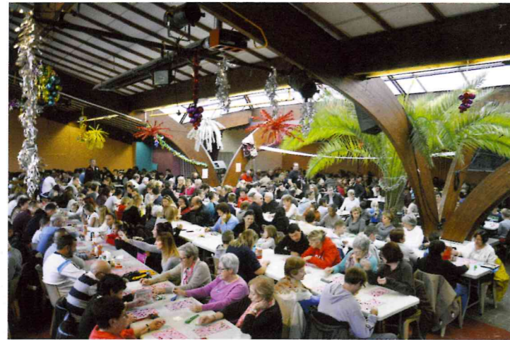
Vous étiez nombreux à venir tenter votre chance au loto organisé par l'ES Cuges