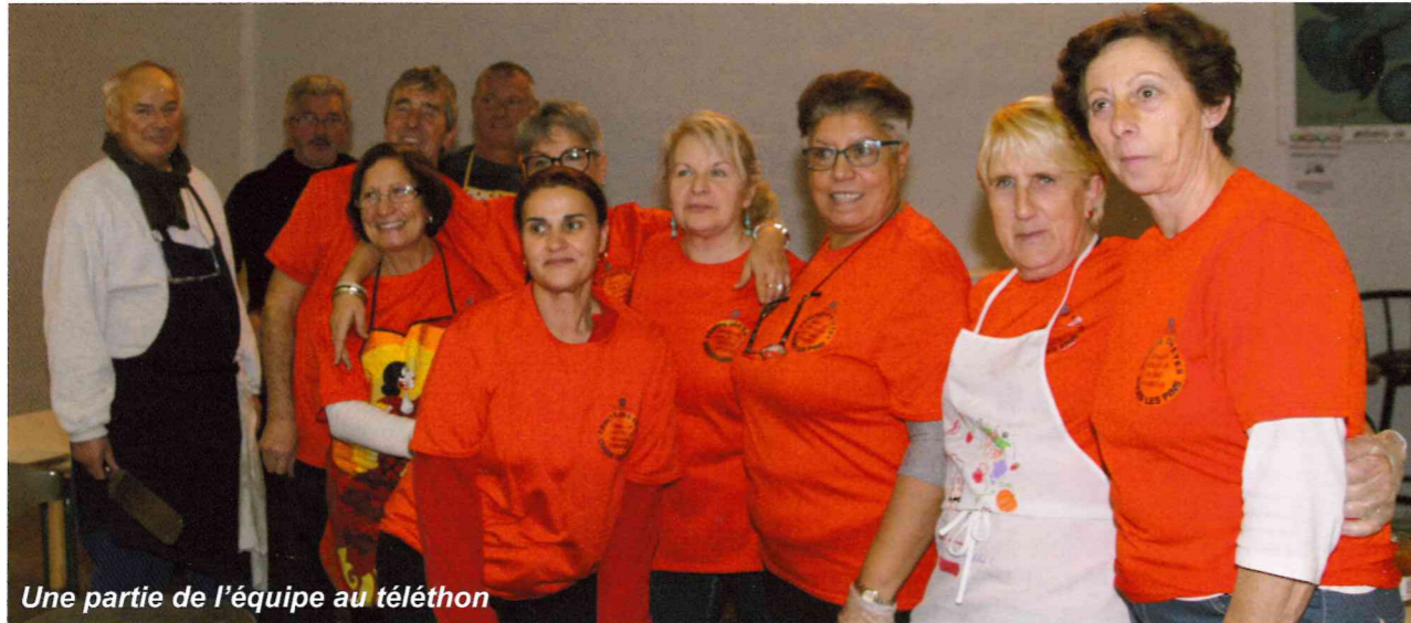
Une partie de l'équipe au téléthon

Créé en 2014, le comité des fêtes de Cuges multiplie les manifestations dans le but de faire de notre commune un lieu vivant où il fait bon vivre et sortir.