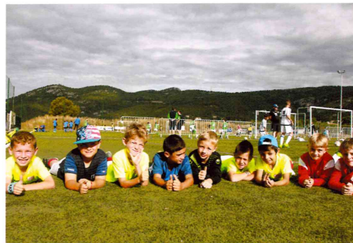
Encore une belle réussite et de nombreux clubs présents pour le tournoi international des débutants.