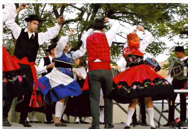
Soirée portugaise organisée par le comité des fêtes