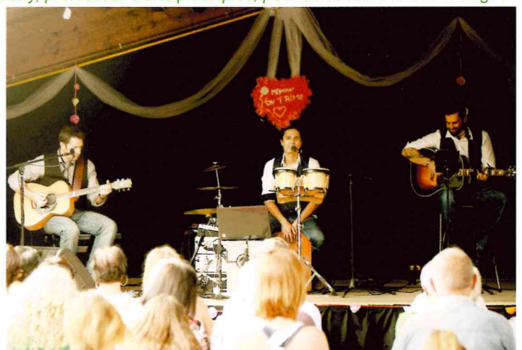
Spectacle offert pour la fête des mères par la municipalité