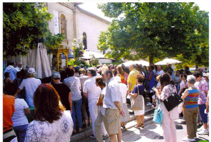
Cette année encore de nombreux pèlerins s'étaient déplacés pour la fête de Saint-Antoine