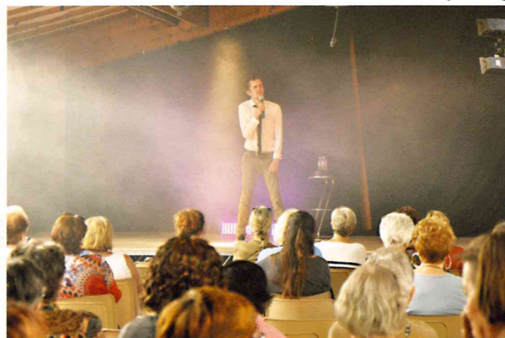
Spectacle d'humour pour la fête des mères à la salle des Arcades