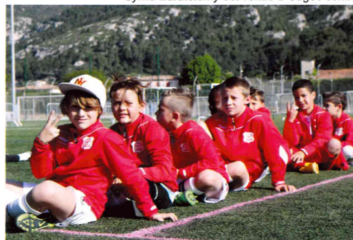
Le tournoi des débutants a réuni cette année encore de nombreux participants avec une ambiance de folie