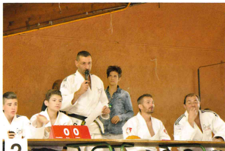
Tournoi de judo organisé par Cuges judo