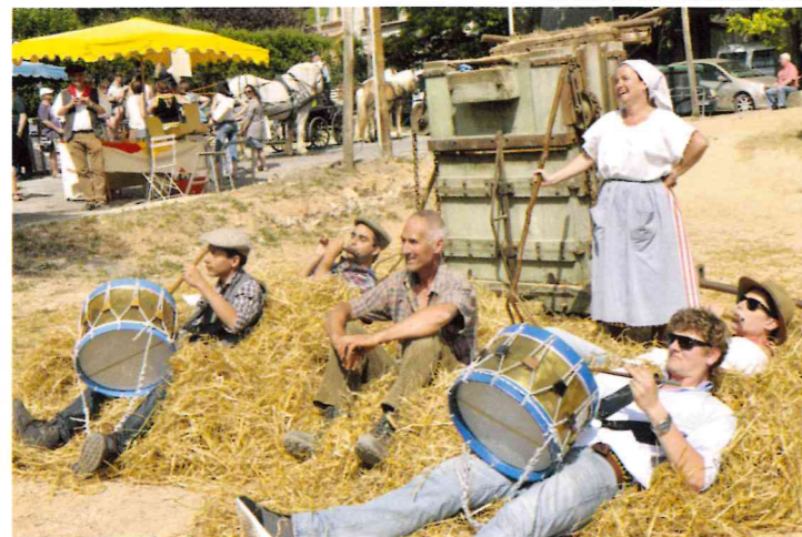
Pour la journée des vieux métiers, c'est détente pour les uns...