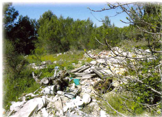
Décharge sauvage au quartier de Barigorne

A Cuges, elles sont de plus en plus nombreuses alors que la déchèterie est à la disposition de tous. Elle possède maintenant une benne à pneus et ouvre en journée continue. Pas d'excuse pour polluer la nature !