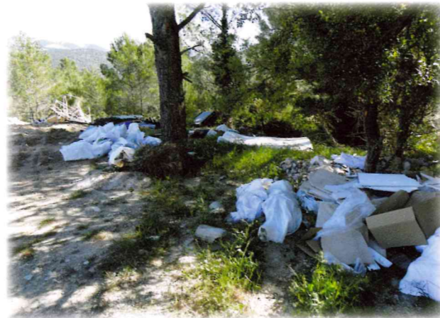
Décharge sauvage au Hameau des Roux

Toute personne qui produit ou détient des déchets dans des conditions de nature à produire des effets nocifs sur le sol, la flore et la faune, à dégrader les sites ou les paysages, à polluer l'air ou les eaux, à engendrer des bruits et des odeurs et, d'une façon générale, à porter atteinte à la santé de l'homme et à l'environnement, est tenue d'en assurer ou d'en faire assurer l'élimination (article L 541 du Code de l'environnement).