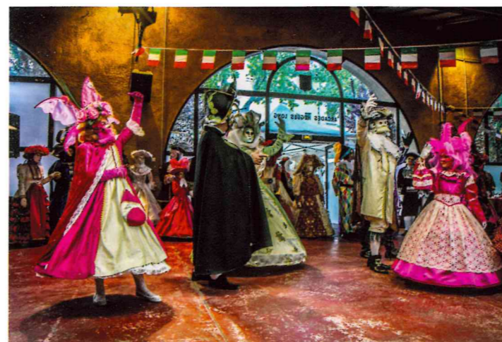
Belle soirée pour le premier anniversaire du jumelage, l'occasion de retrouvailles entre Cugeois et Chiusani