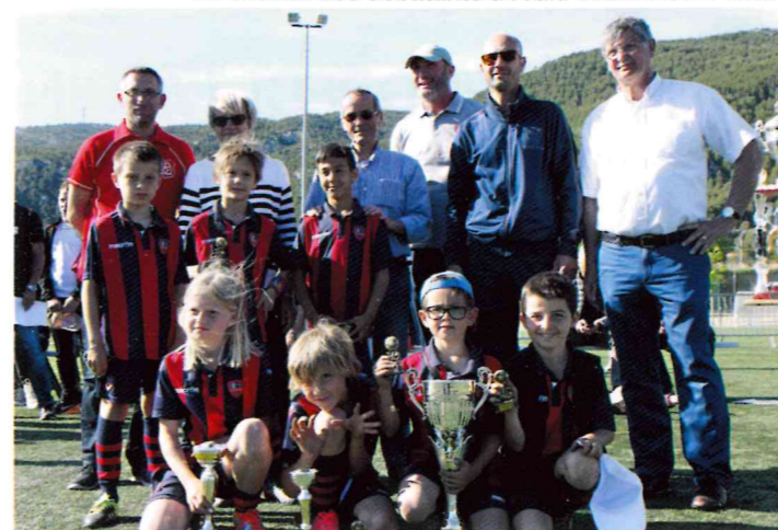
La remise des récompenses a fait la joie des petits et des grands, beau moment d'émotion