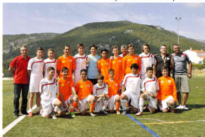
Tournoi de tennis et de foot organisés le 28 mai