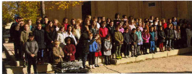
Commémoration de l'armistice de 1918 Samedi 11 novembre 2017 à 11h