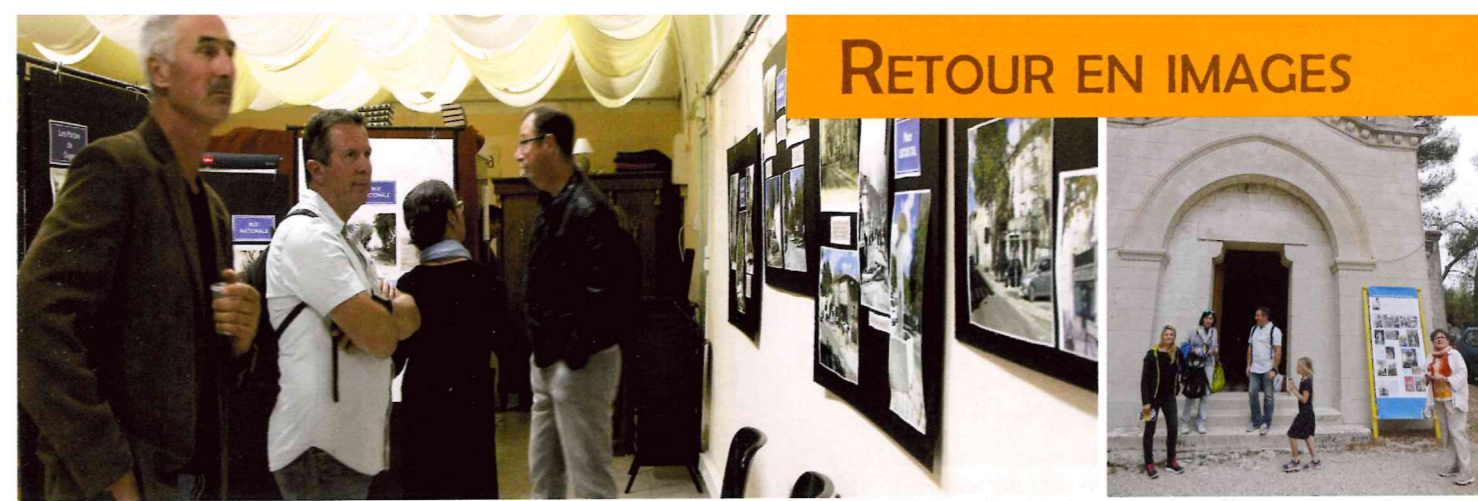
À l'occasion des journées du patrimoine, l'association Cugistoria nous a fait revivre Cuges d'antan à travers une rétrospective en images et en vidéos dans la chapelle des pénitents. L'association des amis de Saint Antoine a quant à elle organisé une visite commentée de la chapelle Saint Antoine.