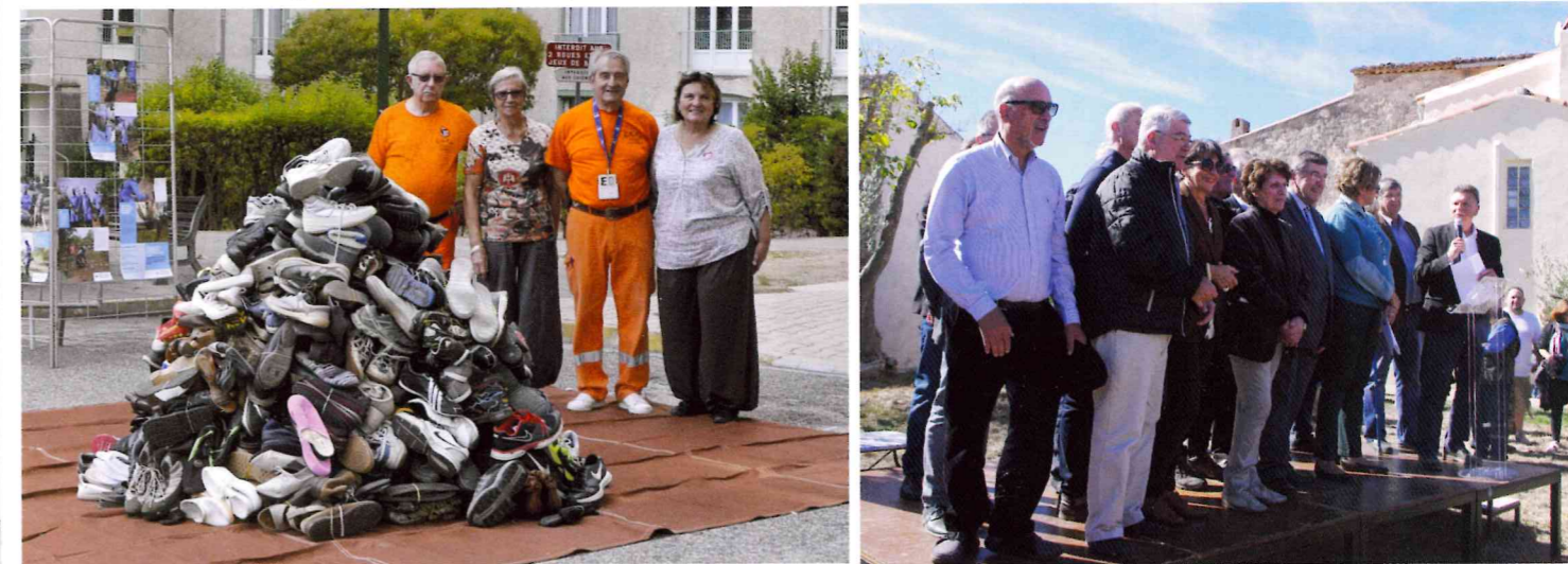
Environ 800 paires de chaussures ont été récoltées lors de la pyramide de chaussures, Merci à tous !