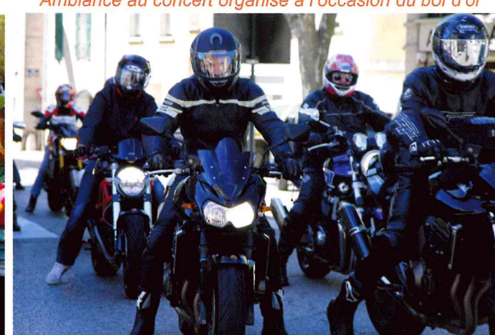
De nombreux motards ont traversé notre village pour se rendre au circuit Paul Ricard