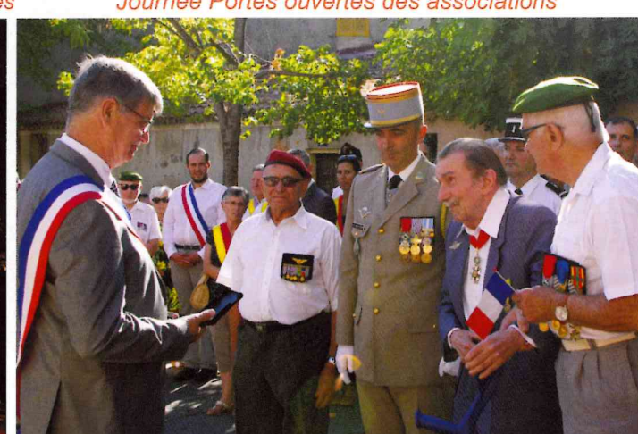
Remise des médailles lors du 20 août dernier