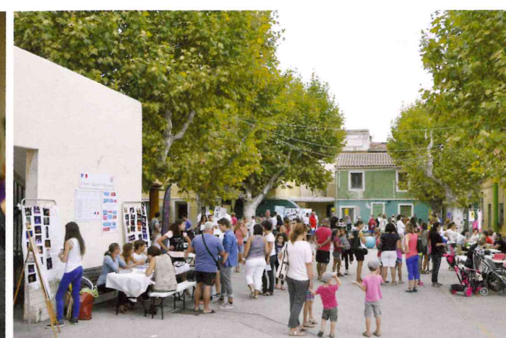
Journée Portes ouvertes des associations