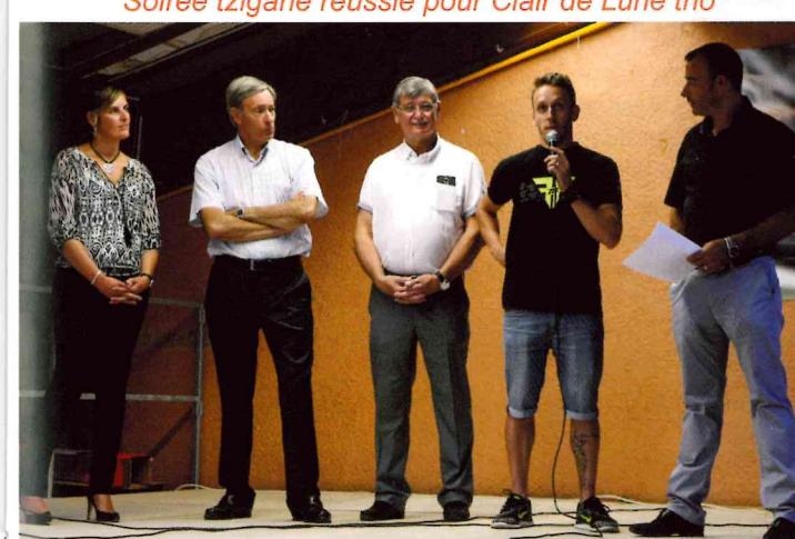
Soirée de lancement du bol d'or à Cuges