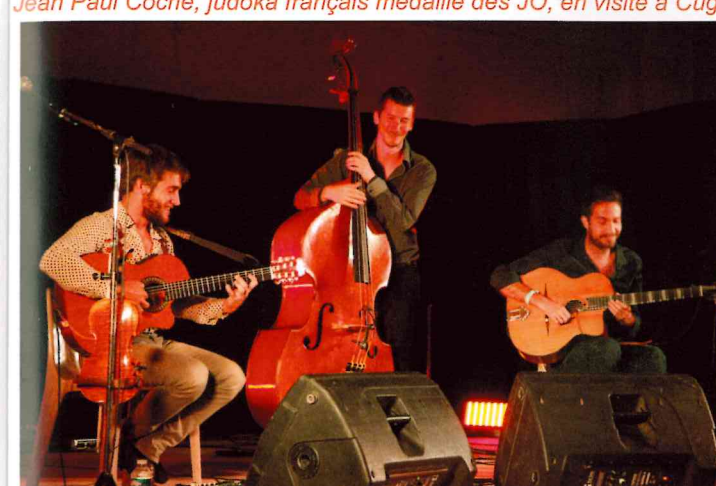
Soirée tzigane réussie pour Clair de Lune trio