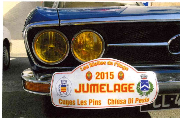
Signature du jumelage à Chiusa di Pesio le 29 août dernier