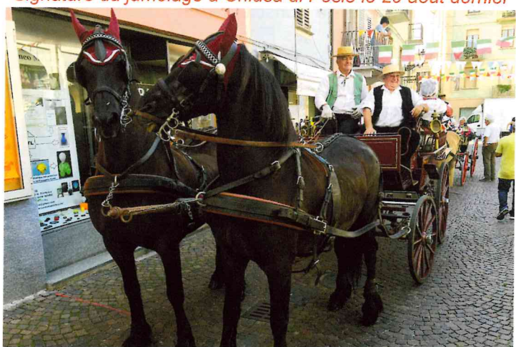
Les calèches de Cuges avaient fait le déplacement