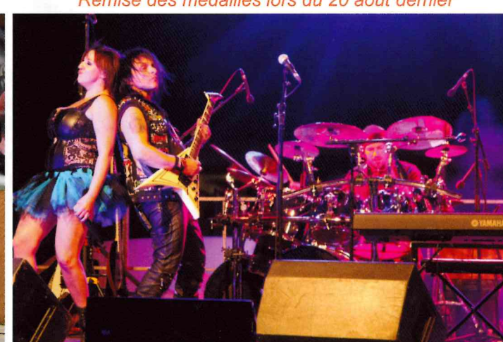
Ambiance au concert organisé à l'occasion du bol d'or