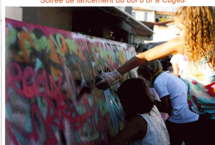
Espace graffs pour le week-end du bol d'or