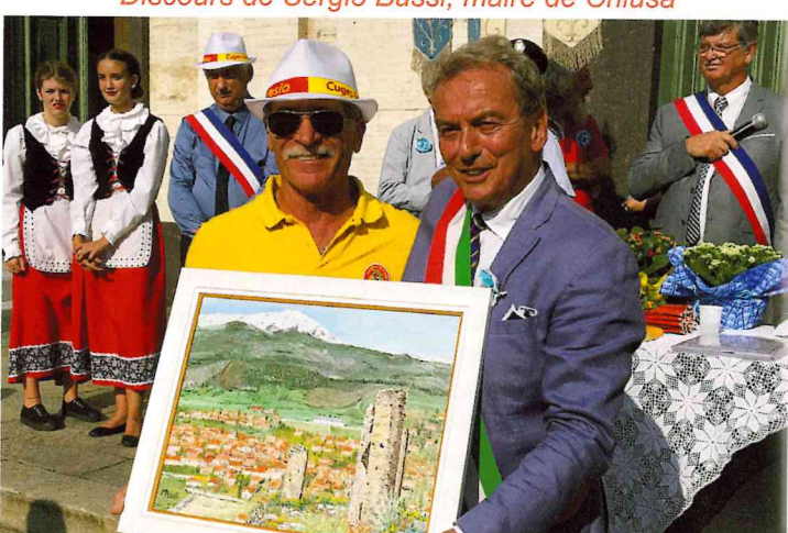
De nombreux présents ont été offert à Chiusa