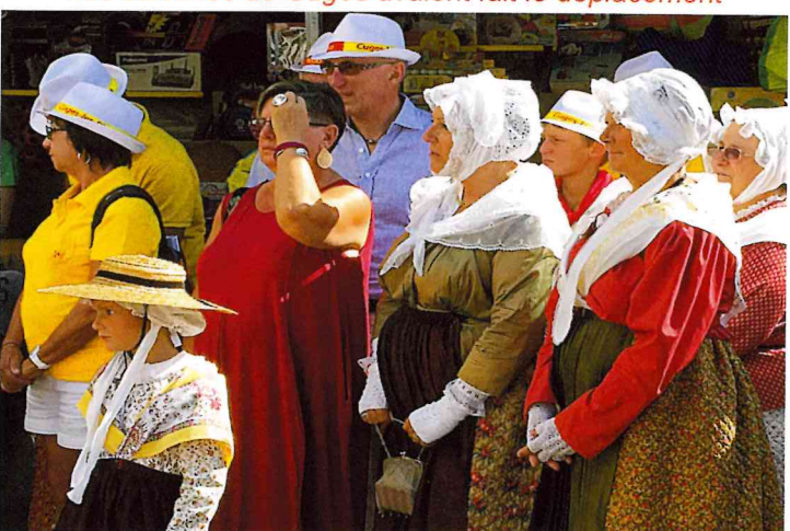
Nos provençales costumées pour l'occasion