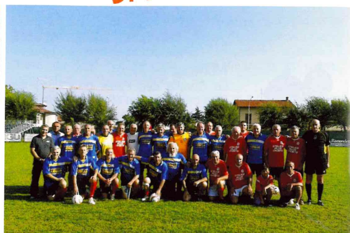
Match amical entre les deux communes